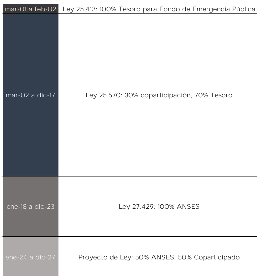
Gráfico 2. Cronología de la distribución del Impuesto sobre los Créditos y Débitos, según proyecto de Ley